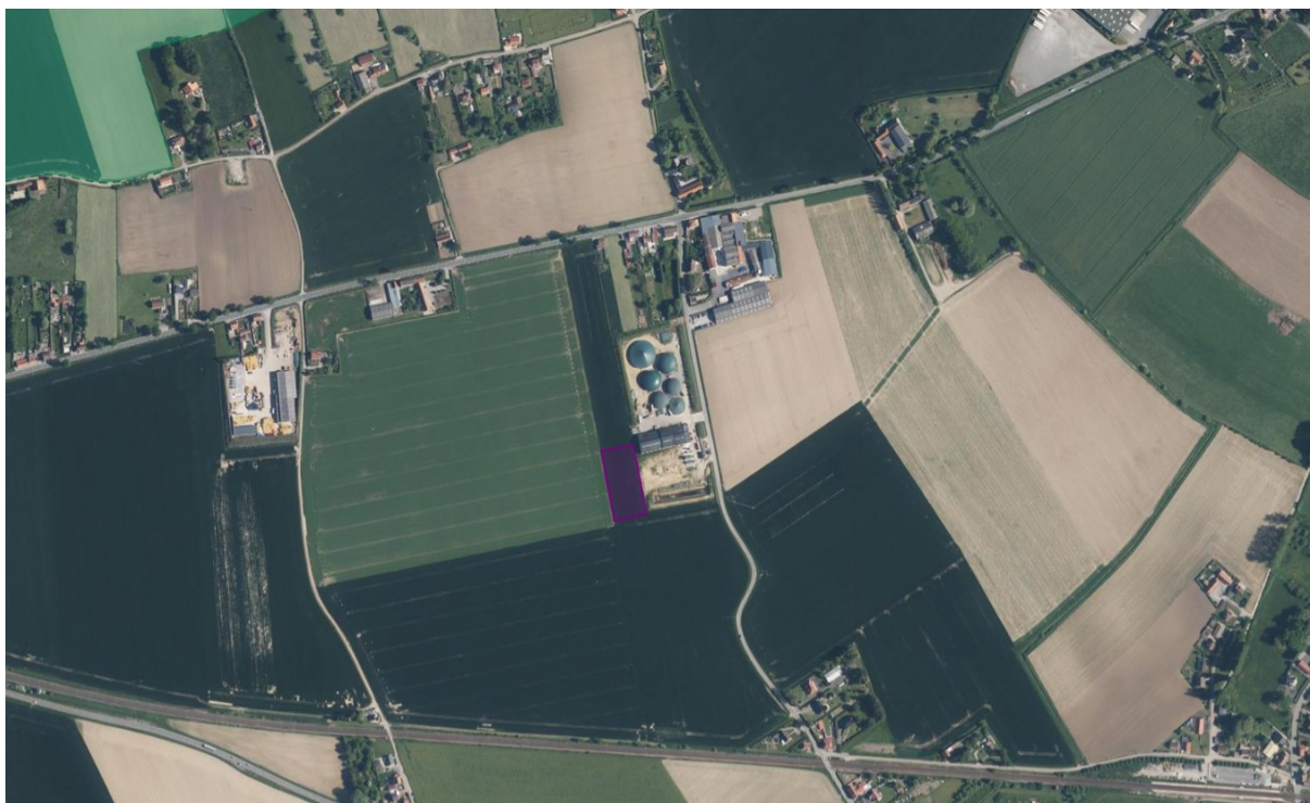
Site du méthaniseur sur la commune de Renescure, avec en violet l'emprise pour la nouvelle lagune de 6 700 m 3

Il relève de l'évaluation environnementale systématique.