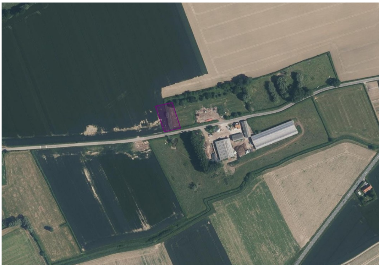
Emprise en violet de la lagune sur la commune de Volckerinckhove de 2 000 m 3